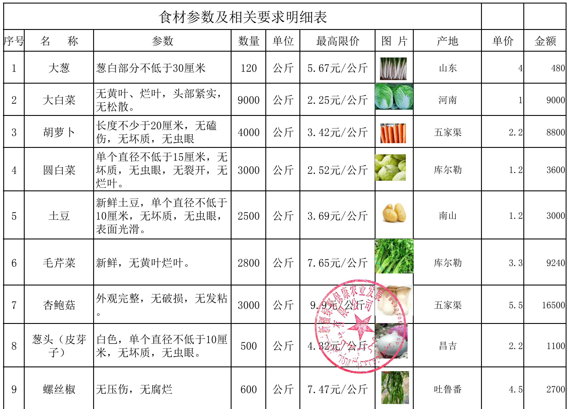
食材参数及相关要求明细表