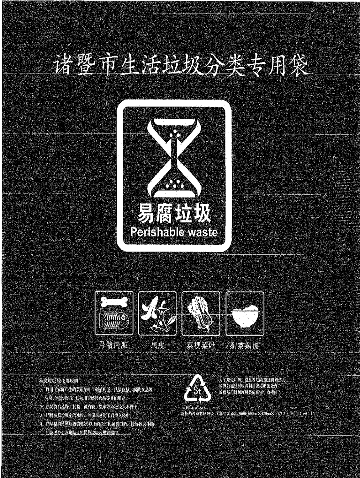
附图1：易腐垃圾袋印刷内容示例