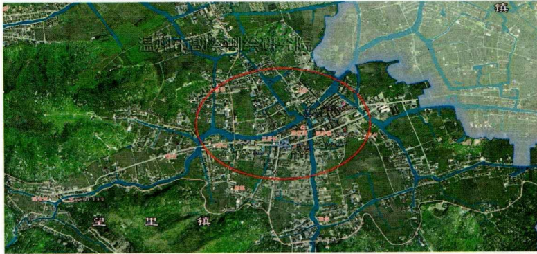
图表 1-望里镇范围示意图

▲本项目保洁服务范围包含保洁区范围内除河道及两侧迎风坡以外的全部内容，包含但不限于：