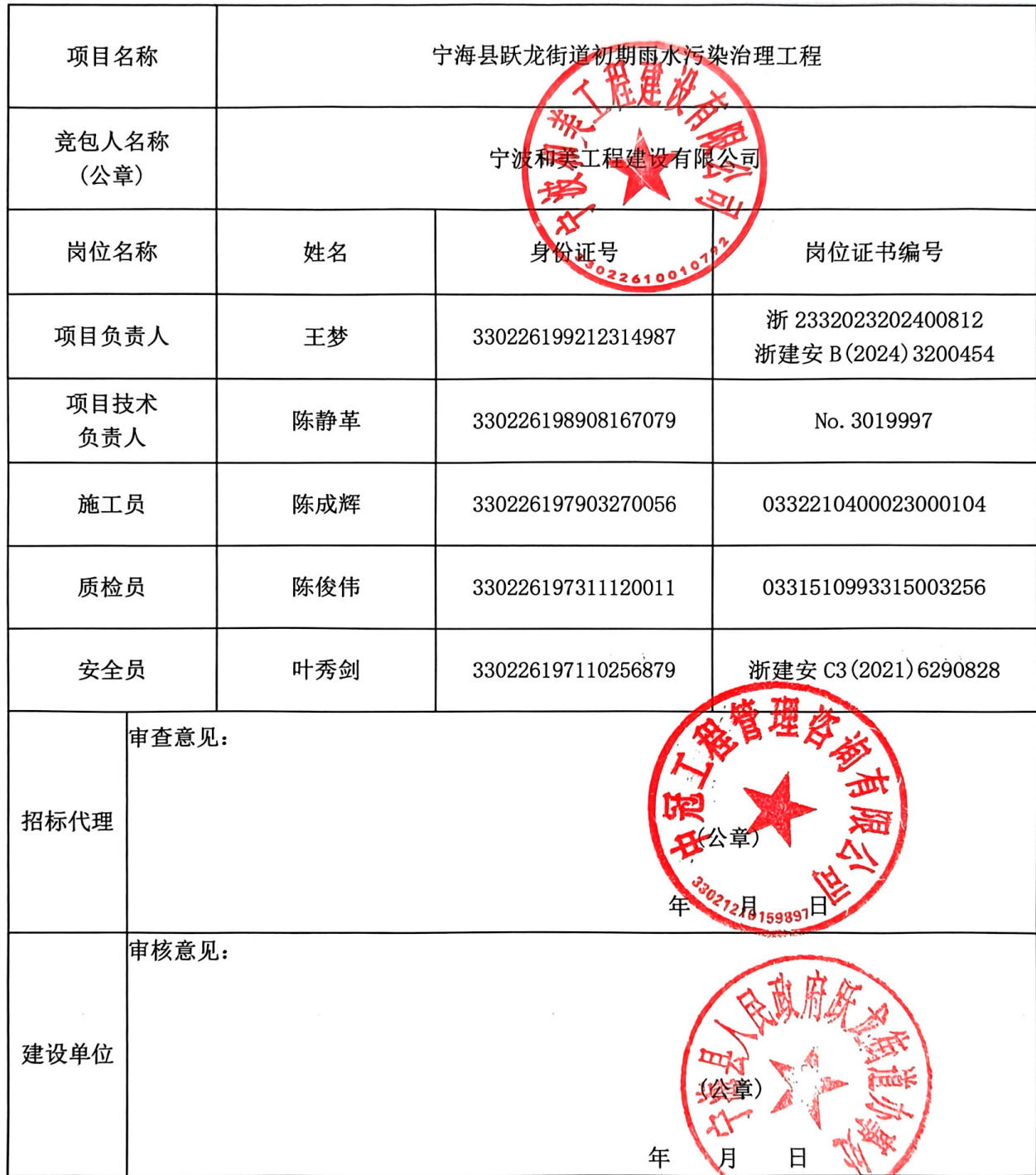
项目部关键岗位人员配备表