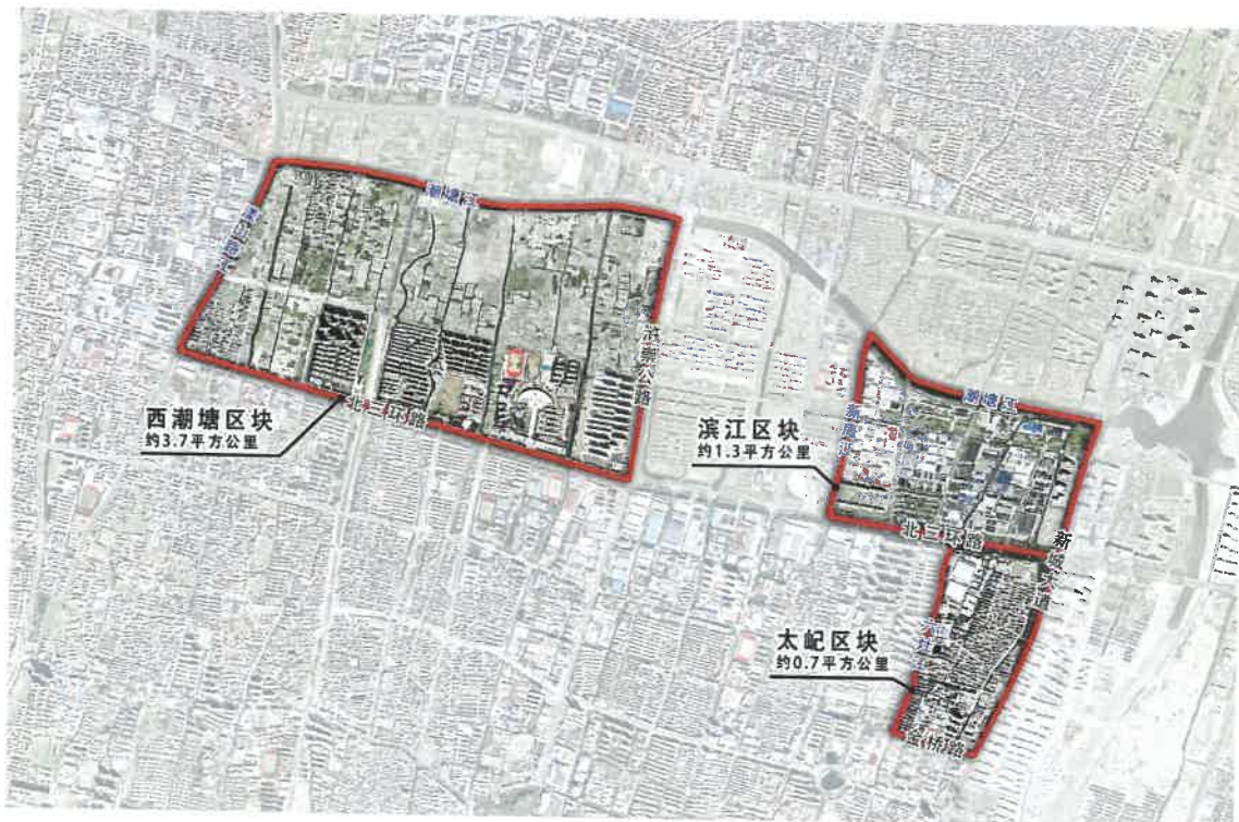
附图：西潮塘区块+滨江区块+太妃区块示意图