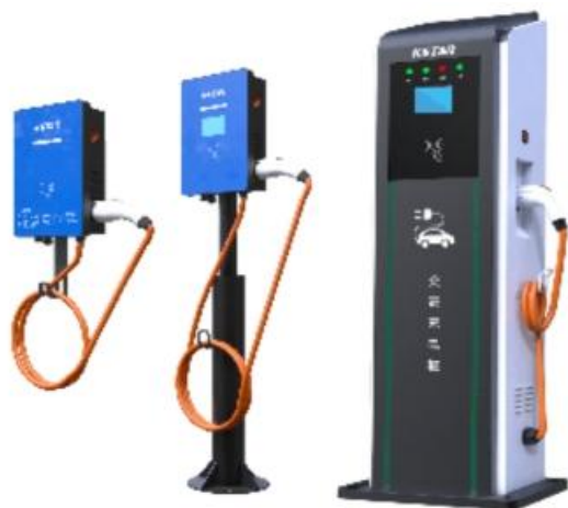
图 5-1 充电桩示意图