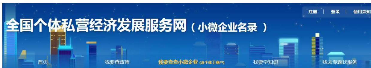
小微企业名录查询截图