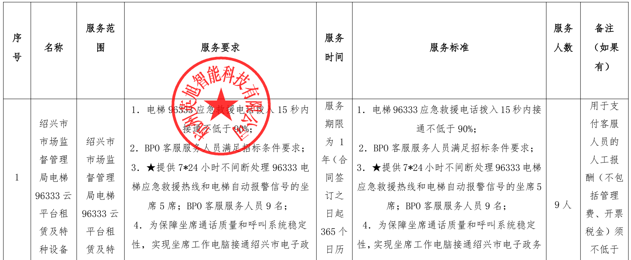
开标一览表（报价表）（单位均为人民币元）

按你方招标文件要求，我们，本投标文件签字方，谨此向你方发出要约如下：如你方接受本投标，我方承诺按照如下开标一览表（报价表）的价格完成绍兴市市场监督管理局电梯 96333 云平台租赁及特种设备应急受理服务项目【招标编号：SXQS-202409-GK094】的实施。