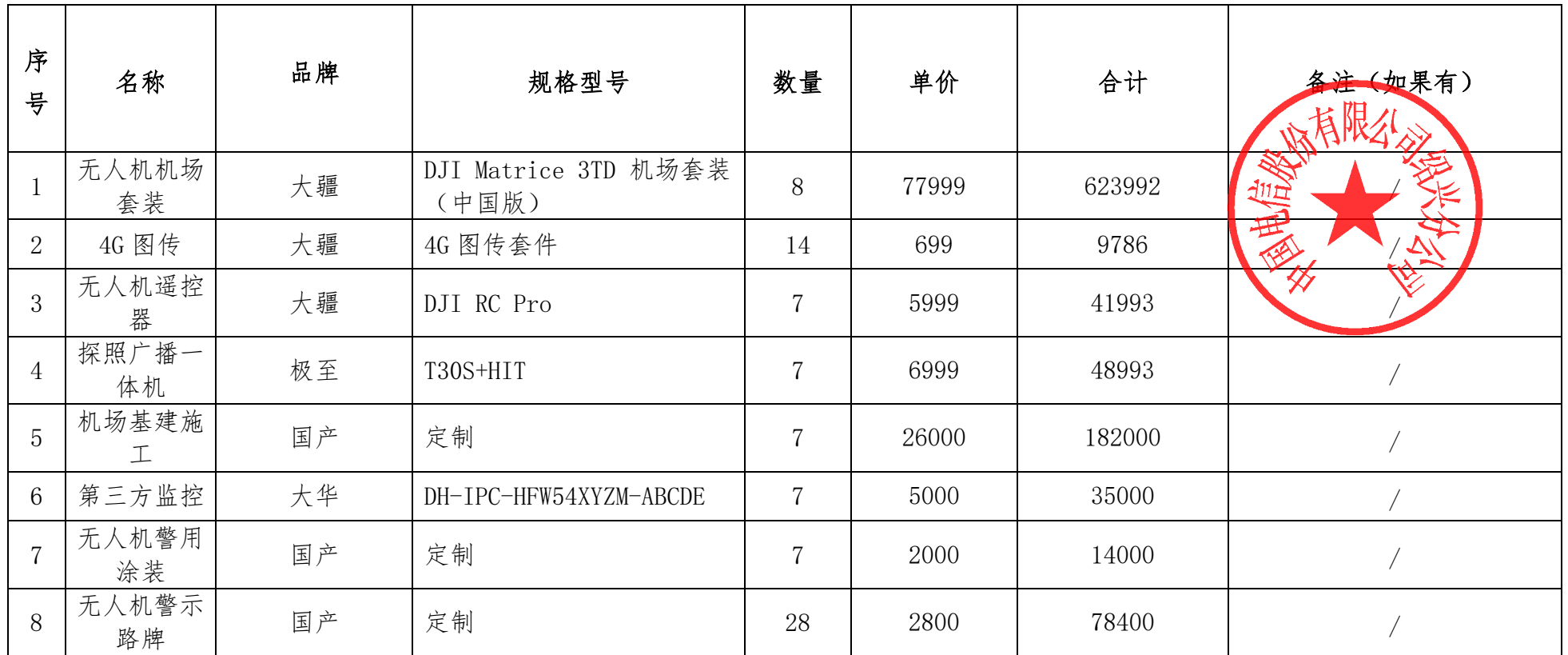
开标一览表（报价表）（单位均为人民币元）

按你方招标文件要求，我们，本投标文件签字方，谨此向你方发出要约如下：如你方接受本投标，我方承诺按照如下开标一览表（报价表）的价格完成（绍兴市公安局高速公路交通警察支队无人机设备采购项目）【招标编号：SXQS-202405-GK052】的实施。