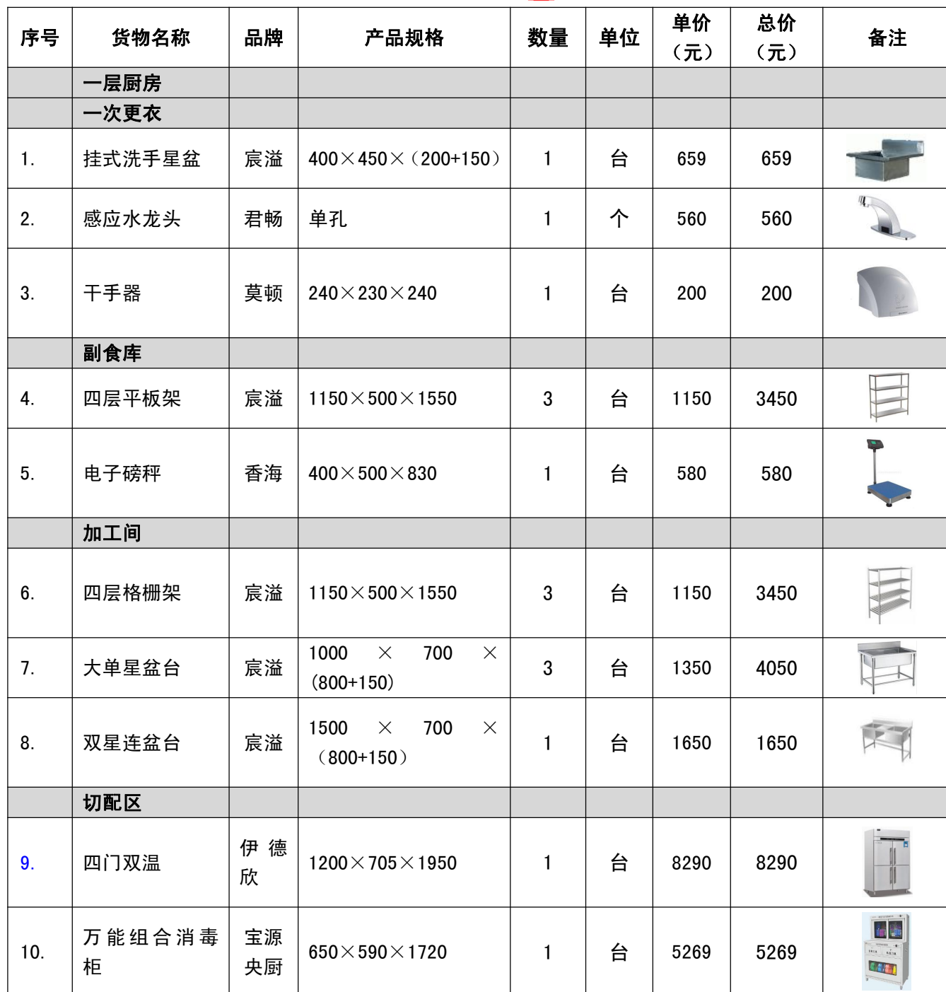
开标一览表（报价表）（单位均为人民币元）

按你方采购文件要求，我们温州宸溢厨房设备有限公司，本投标文件签字方，谨此向你方发出要约如下：如你方接受本投标，我方承诺按照如下开标一览表（报价表）的价格完成（瑞安市曹村镇第二小学拆扩建工程厨房设备）【项目编号：ZJJSCG202404005】的实施。