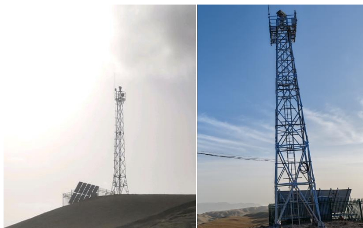
森林资源瞭望塔（基站和天线安装位置）