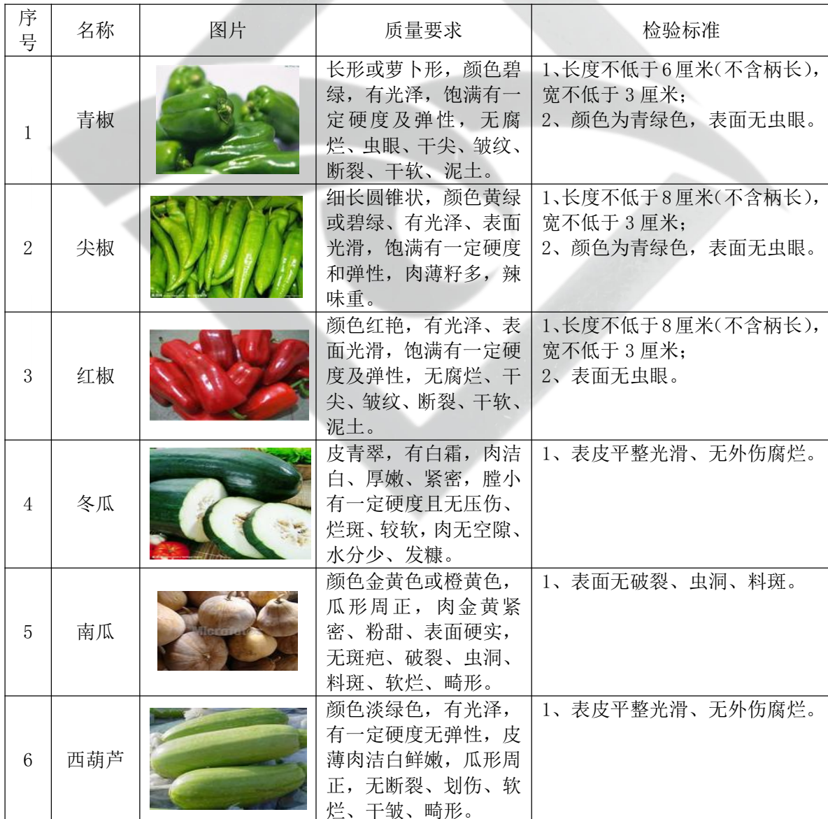
附件：验收标准详细内容

米、面的品质好坏有较明显的区别，主要从含水量、颜色、面筋质和新鲜度等几个方面进行检验。