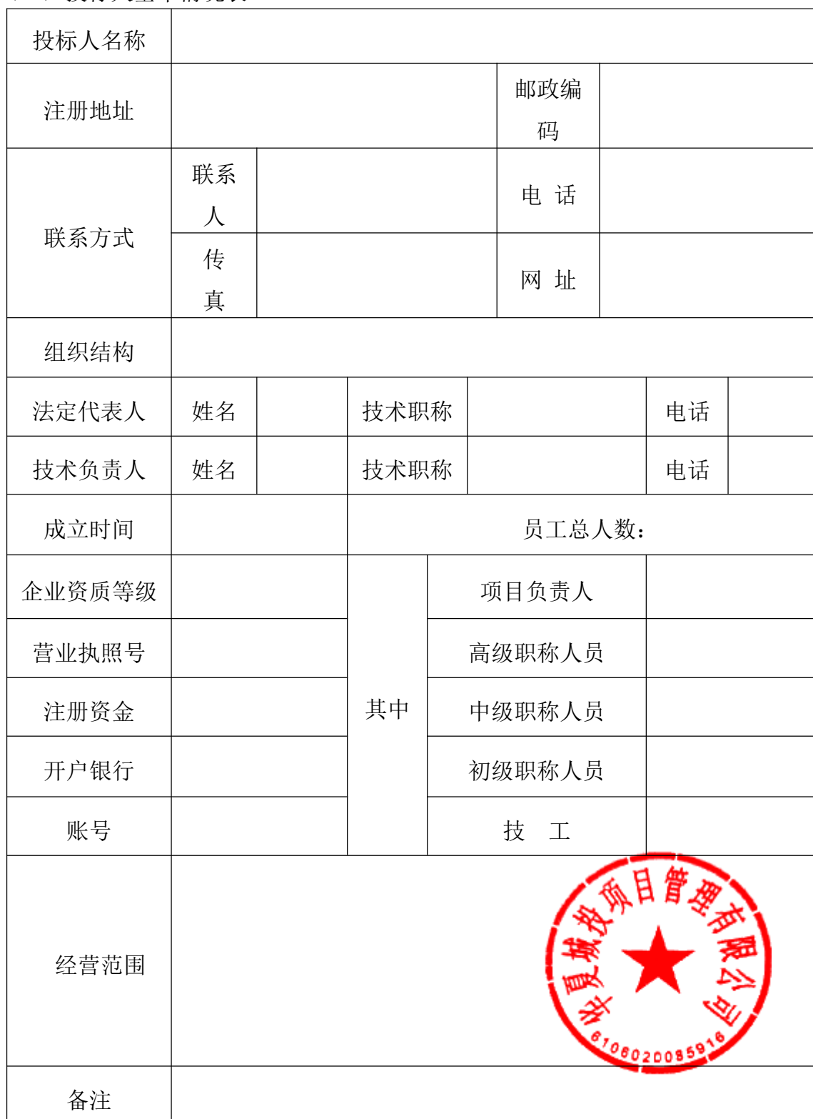
(一) 投标人基本情况表

注：1. 投标人应根据资格审查要求在本表后附相关证明材料（营业执照、社保及税收、财务报告等）。