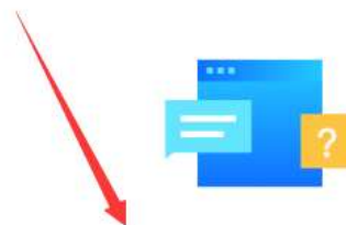
供应商配置管理操作指南