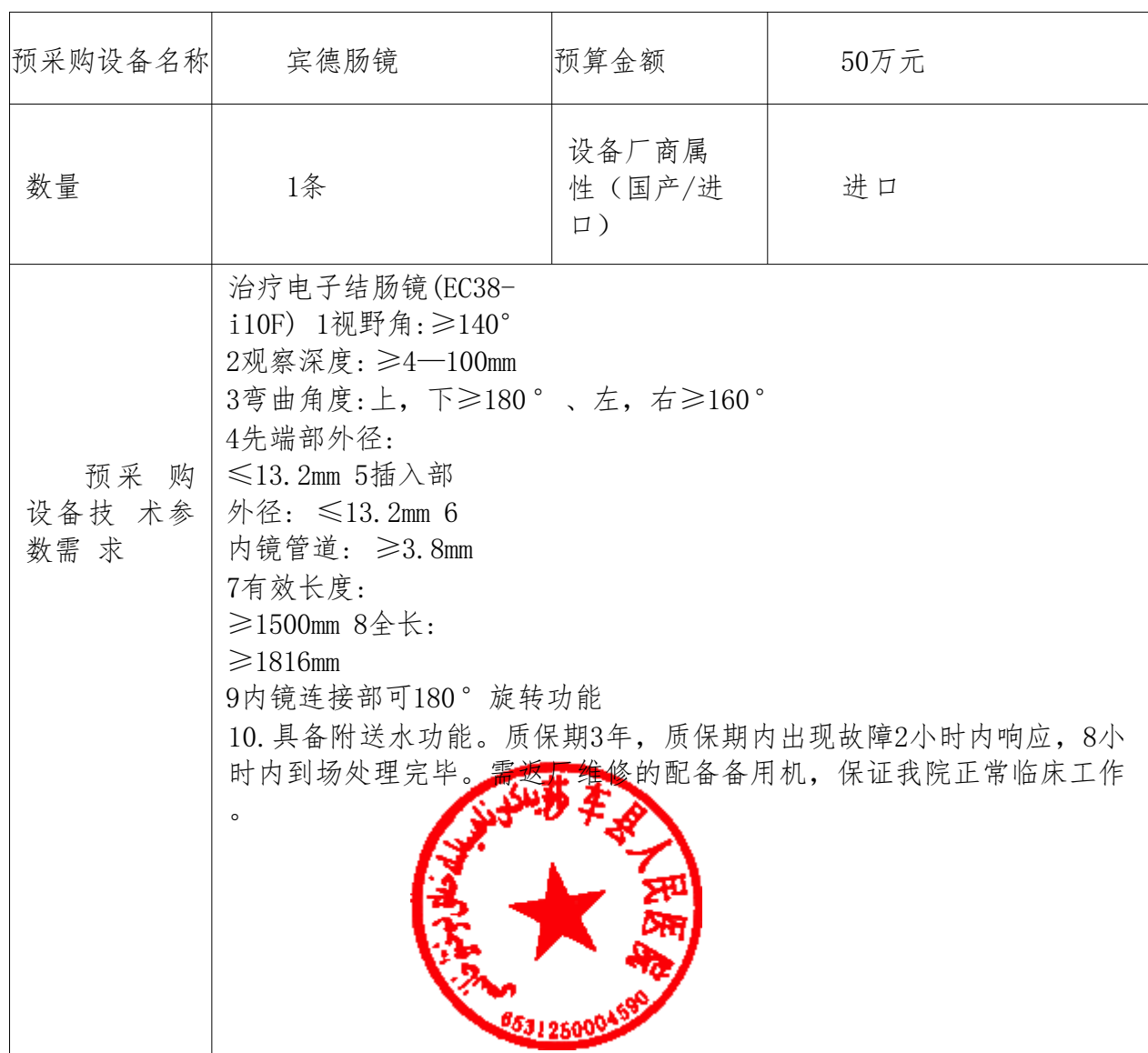
医疗器械招标采购技术参数需求征求表