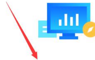
供应商入驻常见问题

四川五洲 SICHUAN WUZHOUBIDDING AGENCY CO.,LTD