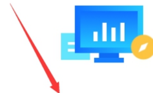
供应商入驻常见问题