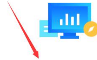
供应商入驻常见问题