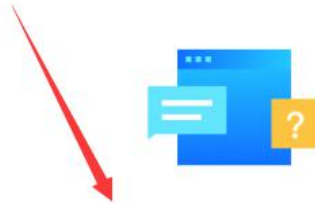
供应商配置管理操作指南