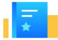
供应商注册操作指南

入驻成为政府采购云平台正式供应商后，供应商才能参与成都项目采购业务 请参考下方操作指南，快速完成入驻