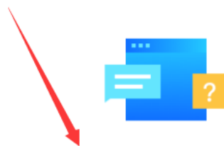
供应商配置管理操作指南