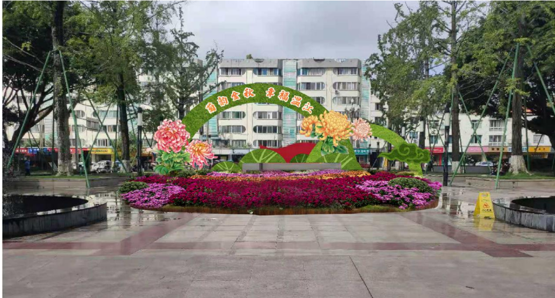
大门背面 温江公园入口（文化路）布展效果图（温江公园牌前面）