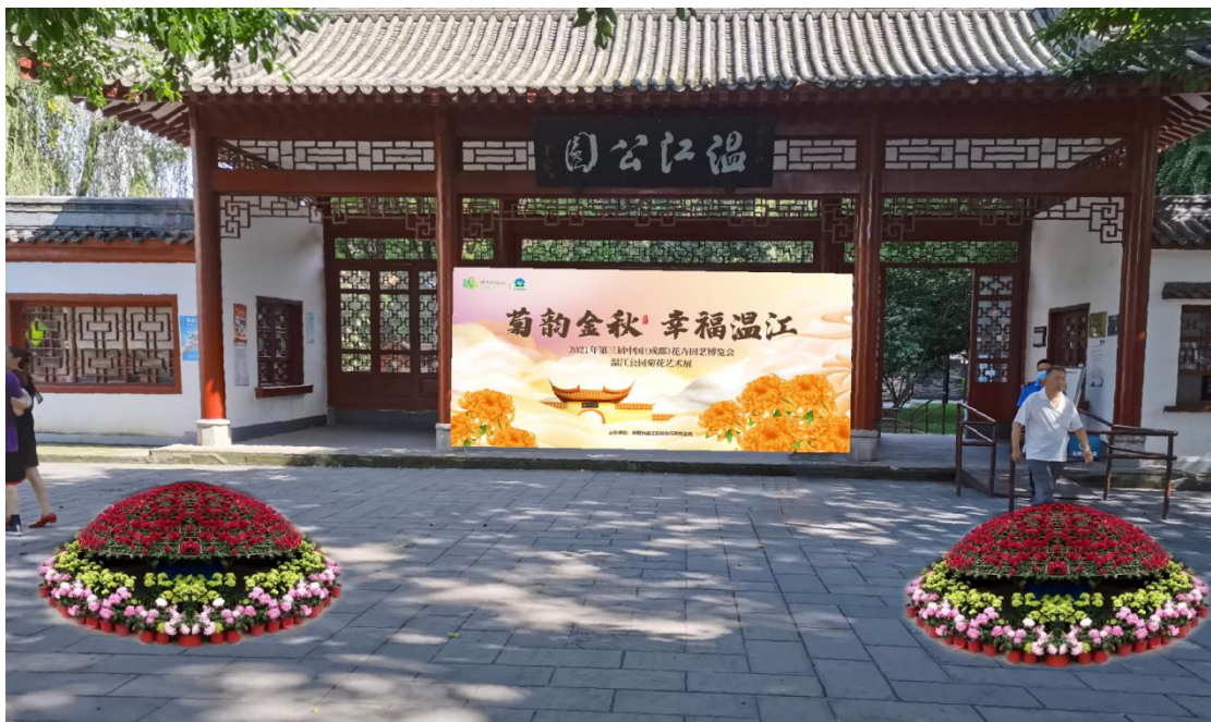
温江公园东门入口布置效果图