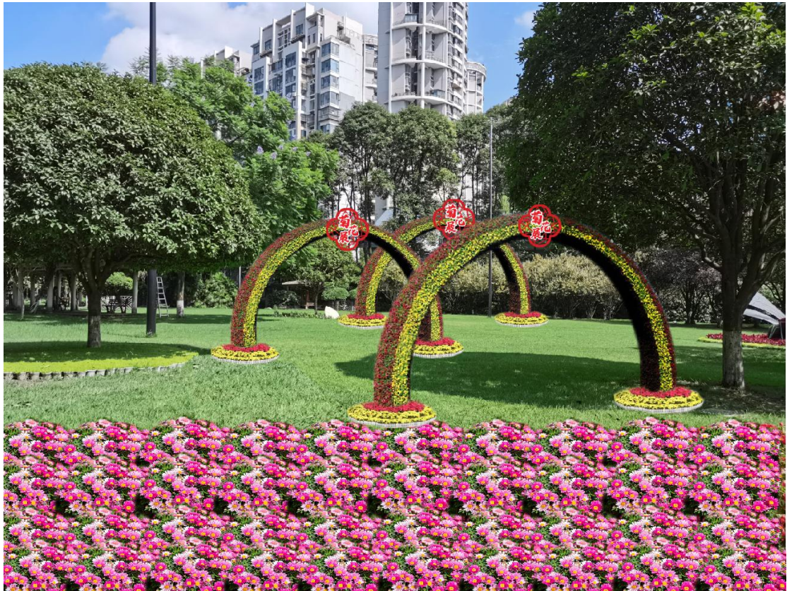
公园草坪布展效果图