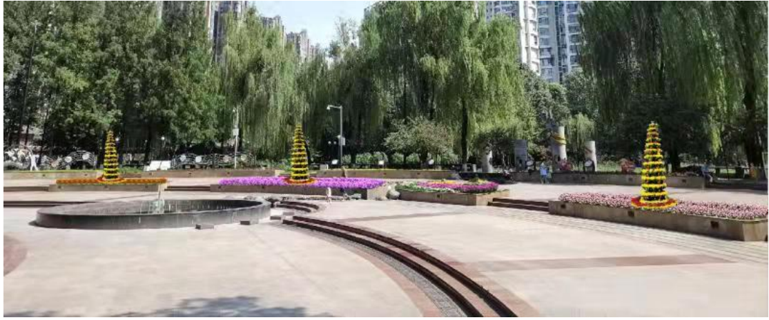
光祈音乐广场布置效果图