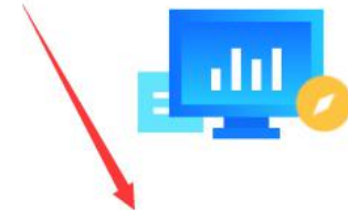
供应商入驻常见问题