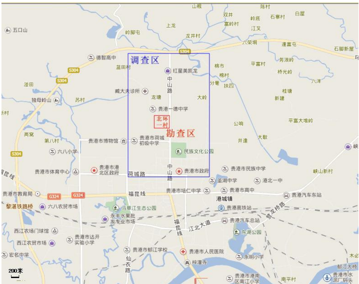
图 1-1 勘查工作区地理位置图

本次勘查工作区是贵港市近几年发展最为迅速的区域,根据城市规划,该区域未来将作为居住、商业、教育科研的中心。目前,整个勘查工作区中南部、北部主要分布住宅小区(含在建、规划)、党政机关、学校、公园及市政主要交通公路,人口密集,活动频繁。勘查区北东部、北西部分布着人口众多的蓝田村、旺茅村、棉村等村屯,村屯内房屋呈片状密集分布,主要为 1~3 层的自建房。勘查工作区北部还分布连片的农田,主要种植水稻为主。