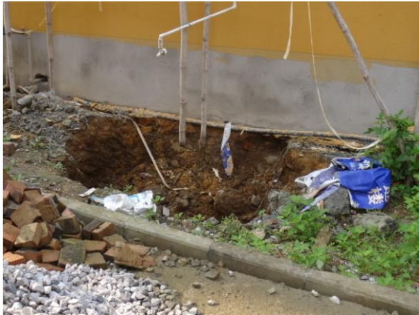
照片 2-5 TX3 塌陷点初塌时照片