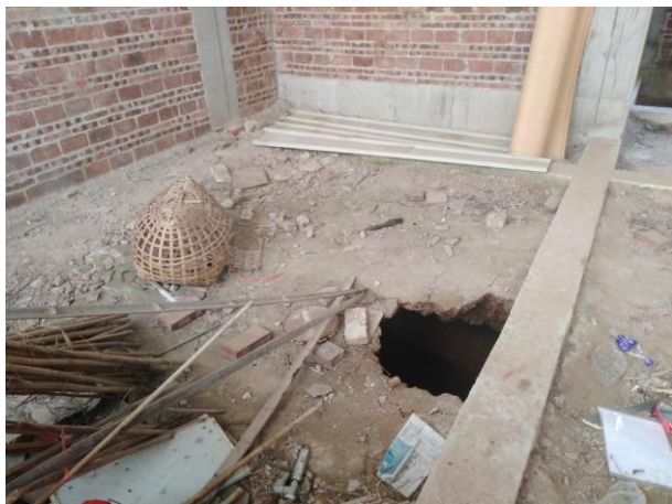
照片 2-9 TX6 塌陷点揭露的坑口