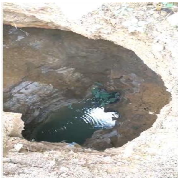
照片 2-12 TX7 塌陷点内景

塌陷点 TX8：发现于 2019 年 6 月 3 日上午 9 时许，塌陷点位于小区 A12 排 6 号房屋门前道路下（照片 2-15、2-16），处于 TX1 塌陷点南侧约 20m 处。塌陷点平面近似椭圆形，塌陷面积约 12m 2 。塌陷坑剖面呈竖直状，深约 2m。坑壁出露松散的地（路）基填土，潮湿，厚约 2~3m，未见基岩出露，坑底有地表积水汇入。塌陷造成北侧 A12 排房屋局部条形基础出露悬空，地下预埋输排水、电路等管网损坏。