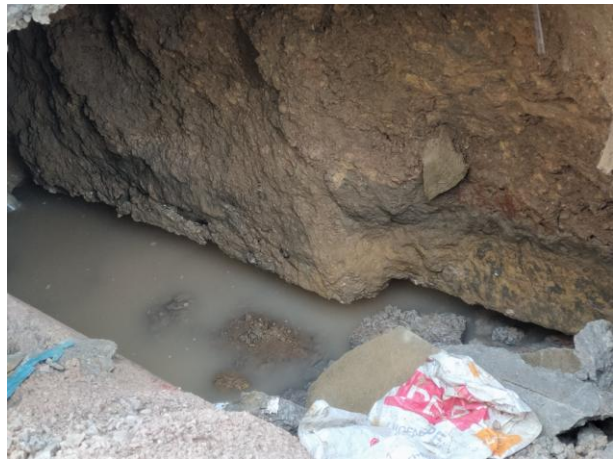
照片 2-14 TX8 塌陷点内景及局部悬空的基础

塌陷点 TX9：发现于 2019 年 6 月 6 日上午 9 时许，塌陷点位于小区 A13 排 6 号房屋后的绿化带内（照片 2-15、2-16），处于 TX1 塌陷点北侧约 15m 处。塌陷点平面近似圆形，揭露的坑口直径约 1m，坑底向南侧房屋下方扩展，总的塌陷面积约 12m 2 。塌陷坑剖面呈碗状，深约 4m。坑壁及坑底出露松散的粘土，潮湿，厚约大于 4m，未见基岩出露，未有积水。塌陷造成北侧 A12 排房屋及局部条形基础出露悬空，。