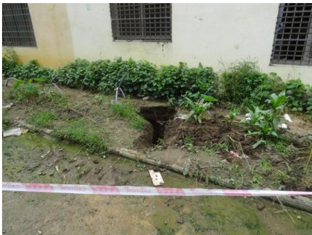
照片 2-15 TX9 塌陷点及周边情况

塌陷点 TX9：发现于 2019 年 6 月 6 日上午 9 时许，塌陷点位于小区 A13 排 6 号房屋后的绿化带内（照片 2-15、2-16），处于 TX1 塌陷点北侧约 15m 处。塌陷点平面近似圆形，揭露的坑口直径约 1m，坑底向南侧房屋下方扩展，总的塌陷面积约 12m 2 。塌陷坑剖面呈碗状，深约 4m。坑壁及坑底出露松散的粘土，潮湿，厚约大于 4m，未见基岩出露，未有积水。塌陷造成北侧 A12 排房屋及局部条形基础出露悬空，。