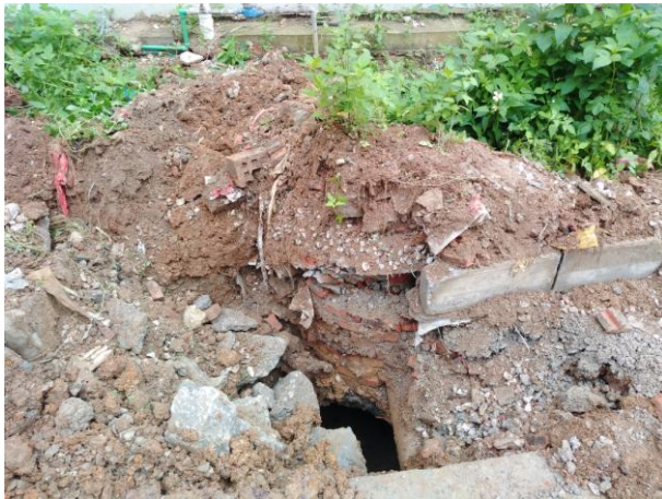
照片 2-7 TX4 塌陷点近景

塌陷点 TX5: 发生于 2019 年 4 月 14 日下午 15:30, 塌陷点位于小区东北角 A4 排一新建房屋旁的绿化带内 (照片 2-8), 处于 TX1 塌陷点北东方向约 150m 处。塌陷点平面近似圆形, 直径 1.4m, 深 1.7m, 塌陷面积约 1.5\text{m}^2 , 塌陷坑内出露松散粘土, 潮湿, 未见基岩出露。经开挖揭露, 塌陷坑内为软塑状粘土, 塌陷坑壁土体潮湿。