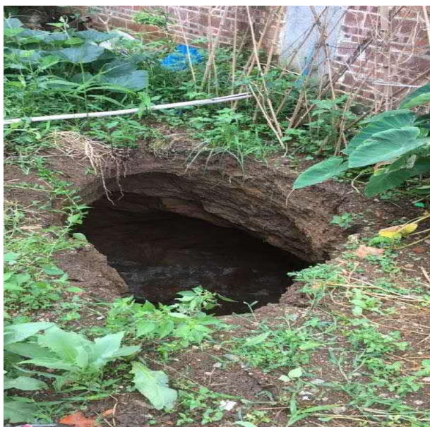
照片 2-11 TX7 塌陷点近景

塌陷点 TX7：发生于 2019 年 5 月 28 日上午 7 时许，塌陷点位于小区 A11 排 4 号房屋北侧的绿化带（照片 2-11、2-12），处于 TX1 塌陷点南西方向约 30m 处，紧邻 TX6 塌陷点，底部互相连通。塌陷点平面为圆形，直径约 2.5m，塌陷面积约 5m 2 。塌陷坑剖面呈壶状，深约 11.5m。坑壁上部出露松散粘土，潮湿，厚约 2~3m，下部为基岩，节理裂隙发育，溶蚀痕迹明显，坑底可见地下水出露，水位埋深约 6m，水质较清澈。