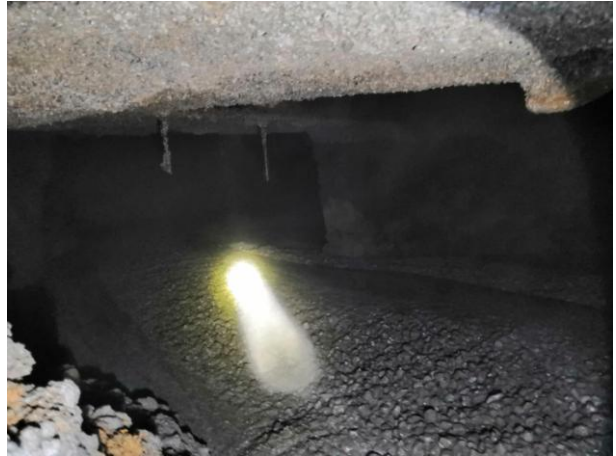
照片 2-6 TX3 塌陷点开挖揭露回填照片

塌陷点 TX4: 发生于 2019 年 4 月 14 日上午 10 时许, 塌陷点位于小区 A14 排 7 号陆增敏户房屋后绿化带 (照片 2-7), 处于 TX3 塌陷点西侧 3m 处。塌陷点紧邻污水井, 上部松散土体尚未完全垮塌, 仅揭露一个近似方形的坑口, 边长约 0.4m, 塌陷坑深约 1m, 坑内出露松散粘土, 潮湿, 未见地下水, 未见基岩出露。经开挖揭露, 塌陷坑向北侧道路下面、化粪池的下方延伸, 塌陷坑内为软塑、流塑状粘土, 塌陷坑壁土体潮湿。