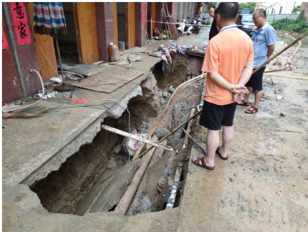
照片 2-13 TX8 塌陷点及周边情况