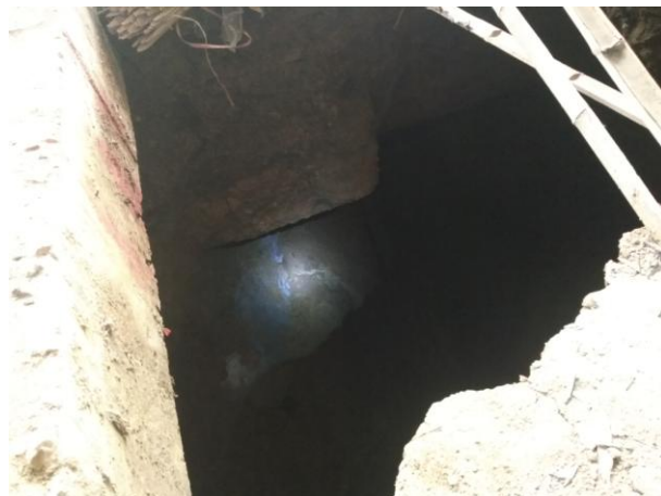
照片 2-10 TX6 塌陷点近景

塌陷点 TX7：发生于 2019 年 5 月 28 日上午 7 时许，塌陷点位于小区 A11 排 4 号房屋北侧的绿化带（照片 2-11、2-12），处于 TX1 塌陷点南西方向约 30m 处，紧邻 TX6 塌陷点，底部互相连通。塌陷点平面为圆形，直径约 2.5m，塌陷面积约 5m 2 。塌陷坑剖面呈壶状，深约 11.5m。坑壁上部出露松散粘土，潮湿，厚约 2~3m，下部为基岩，节理裂隙发育，溶蚀痕迹明显，坑底可见地下水出露，水位埋深约 6m，水质较清澈。