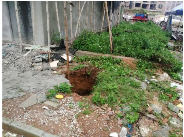
照片 2-8 TX5 塌陷点近景

塌陷点 TX6: 发生于 2019 年 5 月 25 日上午 8 时许, 塌陷点位于小区 A11 排 4 号房屋内 (照片 2-9、2-10), 处于 TX1 塌陷点南西方向约 35m 处。塌陷点平面为不规则状, 塌陷面积约 10\text{m}^2 。塌陷坑上部土体尚未完全垮塌, 仅揭露一个直径约 1m 的坑口。塌陷坑剖面呈漏斗状, 深约 12m, 坑壁上出露松散粘土, 潮湿, 厚约 3~4m, 下部为基岩, 节理裂隙发育, 溶蚀痕迹明显, 可见不规则状的溶槽发育, 坑底可见地下水出露, 水位埋深约