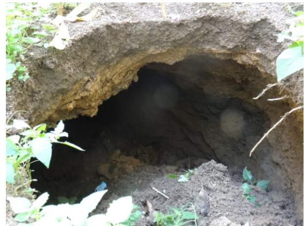
照片 2-4 TX2 塌陷点内景

塌陷点 TX3：发生于 2019 年 4 月 11 日晚 21 时许，塌陷点位于小区 A14 排 8 号韦添耀户房屋后绿化带（照片 2-5、2-6），处于 TX1 塌陷点北侧约 40m 处。塌陷点初现为椭圆形，塌陷面积约 6.5\text{m}^2 ，塌陷坑深 1.2m。未见地下水，未见基岩出露。经开挖揭露，塌陷坑向房屋的地面下延伸约 5m，宽度约 8m，深度约 5m，塌陷坑平面投影面积约 40\text{m}^2 ，塌陷坑体积约 200\text{m}^3 。由于塌陷坑位于房屋地面下，对调查的安全无保障，无法进入内部调查，未能观察到是否见地下水、是否见基岩。