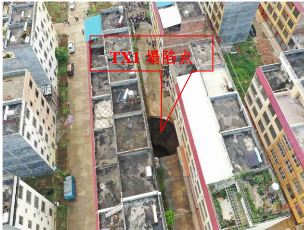
照片 2-1 TX1 塌陷点位置及周边情况

厨房墙体开裂，裂缝宽 0.2~1cm，长约 5m。廖怀新与廖祝先两户房屋中间发生纵向错裂，裂缝从一层发育至顶层，高约 15m，宽 1~2cm。