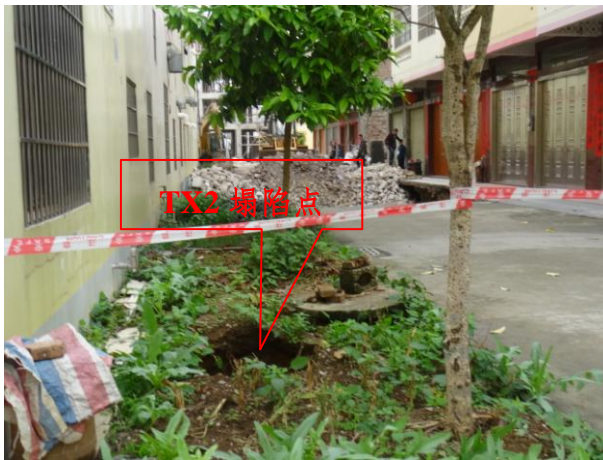
照片 2-3 TX2 塌陷点位置及周边情况照片

塌陷点 TX2：发生于 2019 年 4 月 12 日凌晨 1 时许，塌陷点位于小区 A12 排 9 号刘雪雅户房屋后绿化带（照片 2-3、2-4），处于 TX1 塌陷点东侧约 10m 处。塌陷点平面近似椭圆形，塌陷面积约 3\text{m}^2 ，深 2m，未见地下水，未见基岩出露。经开挖揭露，塌陷坑内为软塑、流塑状粘土，塌陷坑壁土体潮湿。