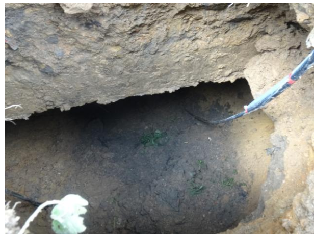
照片 2-16 TX9 塌陷点内景及局部悬空的基础