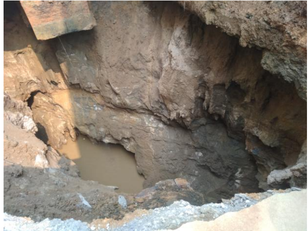
照片 2-2 TX1 塌陷点内景

塌陷点 TX2：发生于 2019 年 4 月 12 日凌晨 1 时许，塌陷点位于小区 A12 排 9 号刘雪雅户房屋后绿化带（照片 2-3、2-4），处于 TX1 塌陷点东侧约 10m 处。塌陷点平面近似椭圆形，塌陷面积约 3\text{m}^2 ，深 2m，未见地下水，未见基岩出露。经开挖揭露，塌陷坑内为软塑、流塑状粘土，塌陷坑壁土体潮湿。