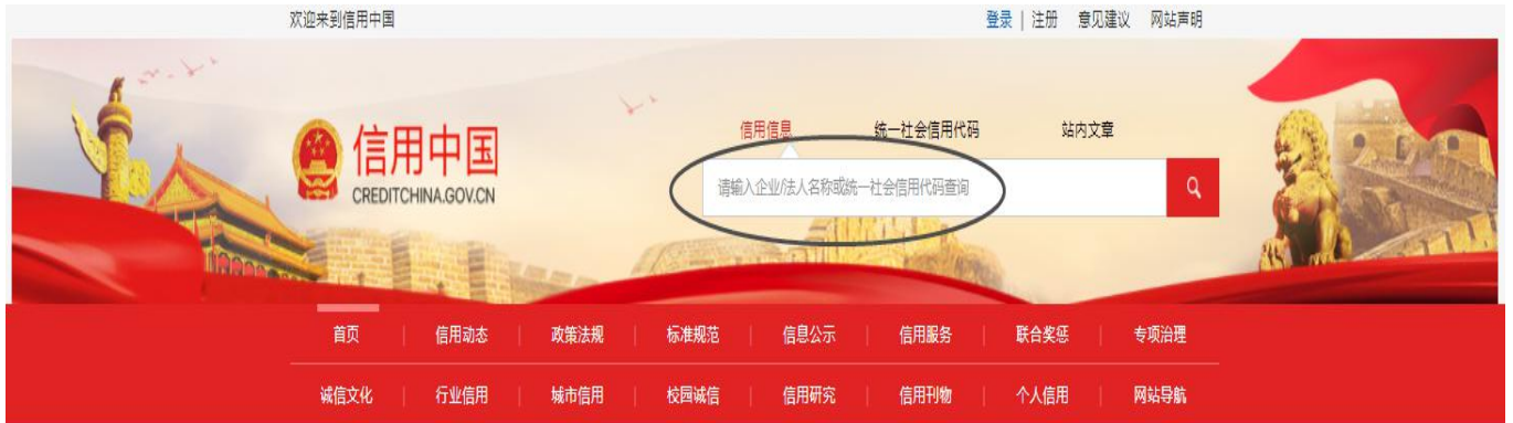
图示二：失信被执行人、重大税收违法案件当事人名单、政府采购严重违法失信行为记录名单查询 步骤 1：