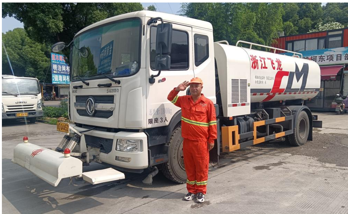
卫生城市美、人间四季春，打造一流品牌服务

感谢您的审阅，若本公司有幸能中标，本公司将对本项目启动精细化管理作业，达到高于业主要求的作业质量，超过业主预期目标。