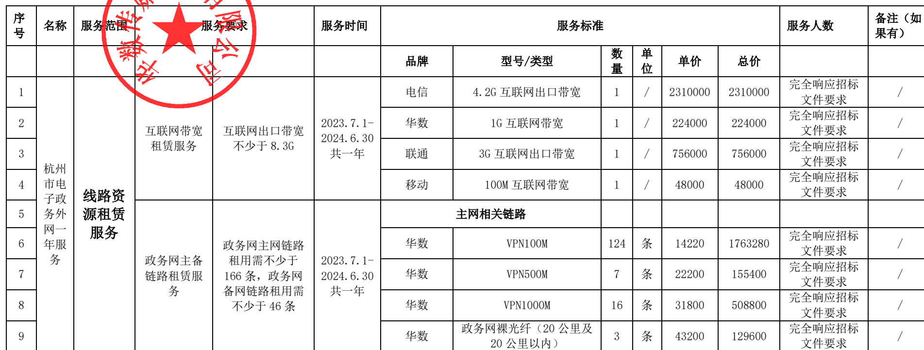
开标一览表（报价表）（单位均为人民币元）

按你方招标文件要求，我们，本投标文件签字方，谨此向你方发出要约如下：如你方接受本投标，我方承诺按照如下开标一览表（报价表）的价格完成杭州市智慧电子政务外网（2023）项目【招标编号：HZZFCG-2023-089】的实施。