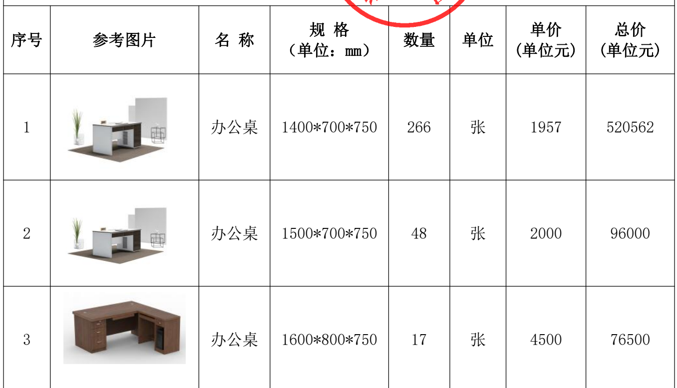
报价明细清单（单位均为人民币元）