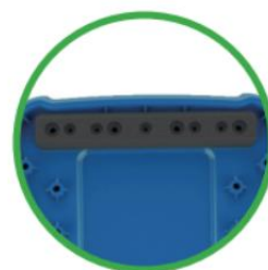
桶底可安装耐磨条