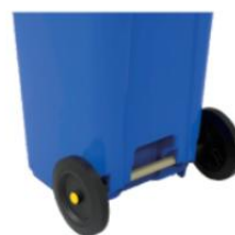
背面底部脚踏设计