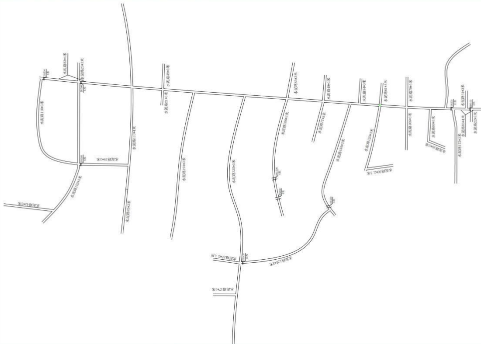
磐石市明城镇葫芦细村巷路建设项目