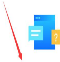
供应商配置管理操作指南