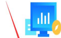
供应商入驻常见问题