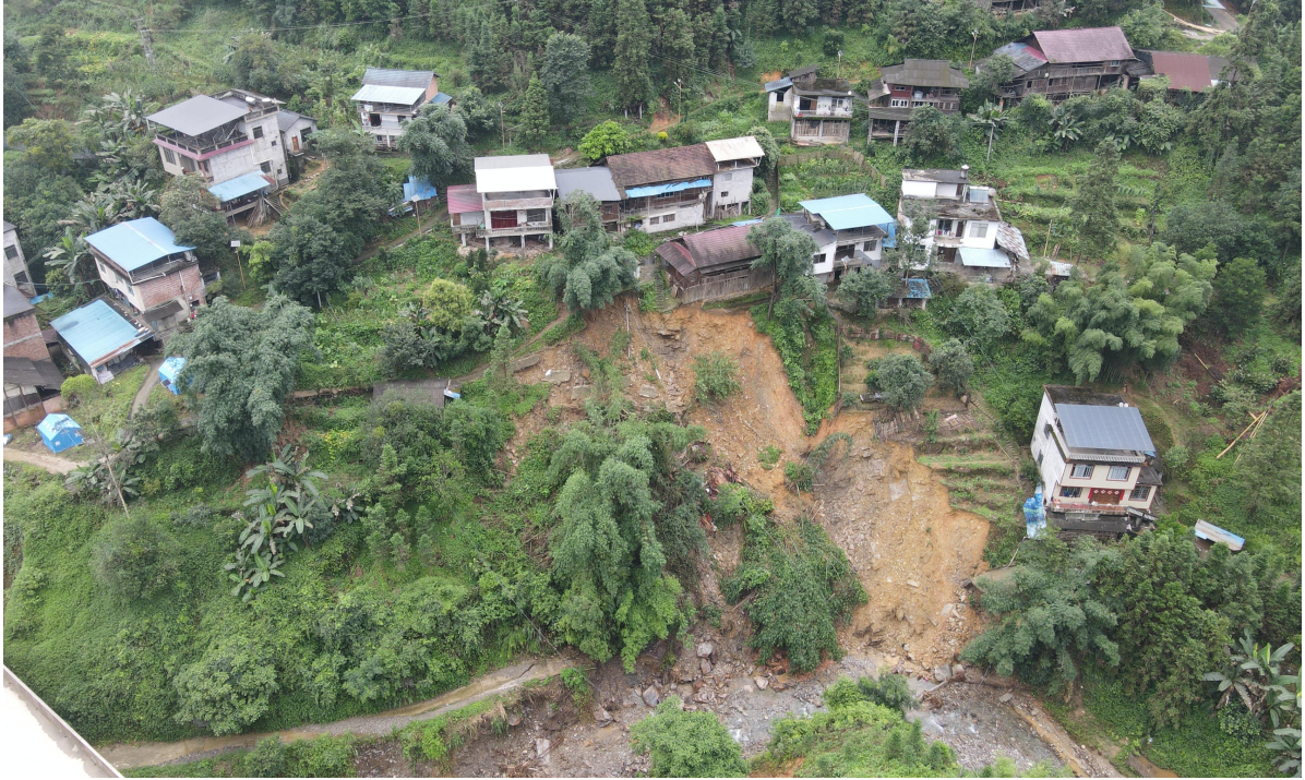
融水苗族自治县四荣乡东田村中落油屯滑坡