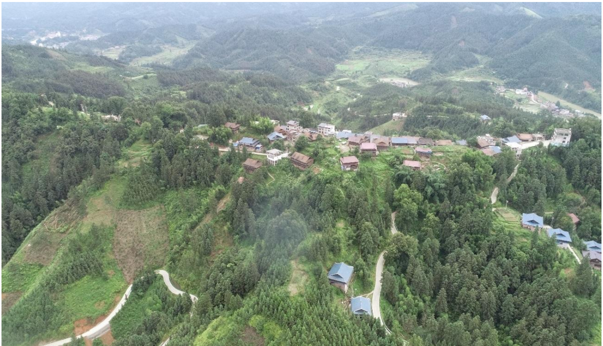
融水苗族自治县良寨乡归坪村高基屯滑坡