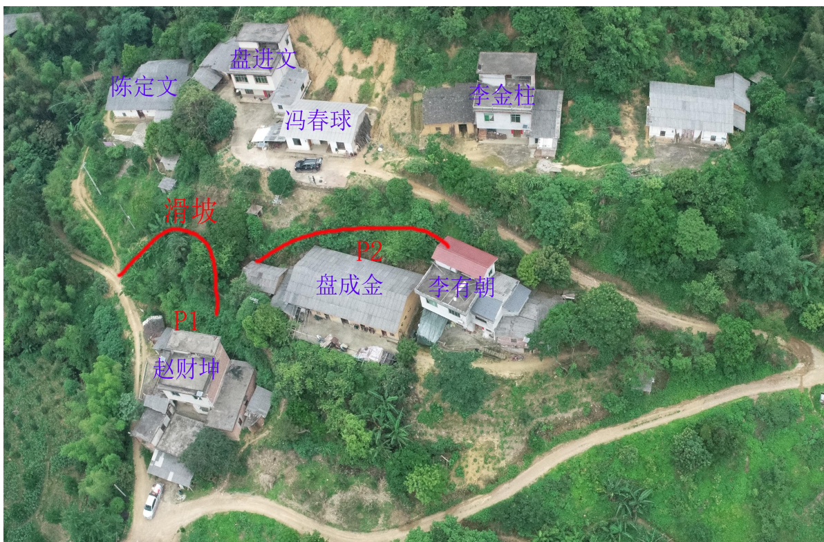
鹿寨县黄冕镇爱国村六其屯滑坡