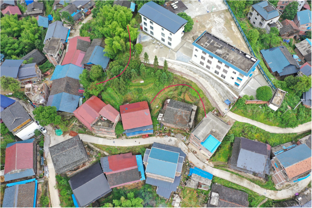
三江侗族自治县富禄苗族乡岑旁村岑旁屯滑坡、崩塌