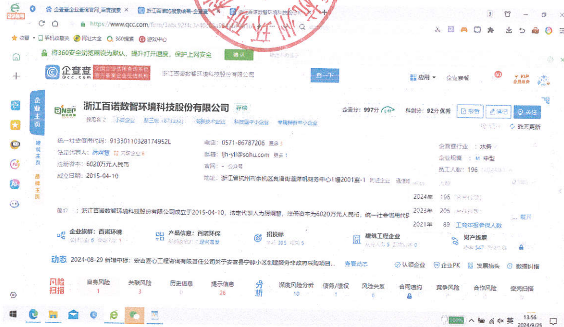
图 2 企查查员工人数

3. 根据工信部网站部长信箱留言：按照现行《中小企业划型标准规定》和《企业会计准则——合并财务报表》，母（总）公司应当将分公司、控股子公司数据合并后划分规模类型；分公司不能独立划型；子公司如为独立法人，可单独