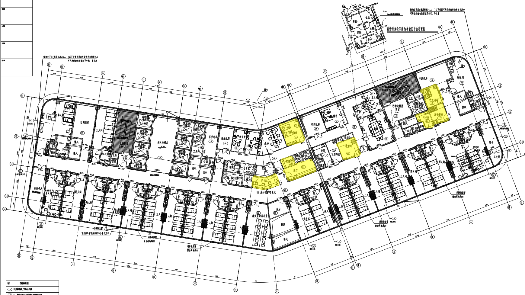
住院楼七层平时平面图 1:300